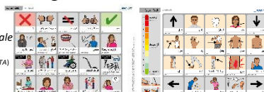
Abb. multilinguale Tafeln (Hrsg. REHAVISTA)

Häufig müssen mehrere Möglichkeiten zur Kommunikation nebeneinander etabliert werden, da sie von den individuellen Fähigkeiten der Betroffenen abhängig sind, die oft Tageschwankungen unterliegen. Ein flexibler Wechsel zwischen den Strategien, abhängig davon, was die Betroffenen am effektivsten zum Ziel bringt, muss geübt werden. Auch PatientInnen mit Sprachbarrieren aufgrund von Fremdsprachigkeit gehören zum Klientel und stellen eine besondere Herausforderung im Klinikalltag dar.